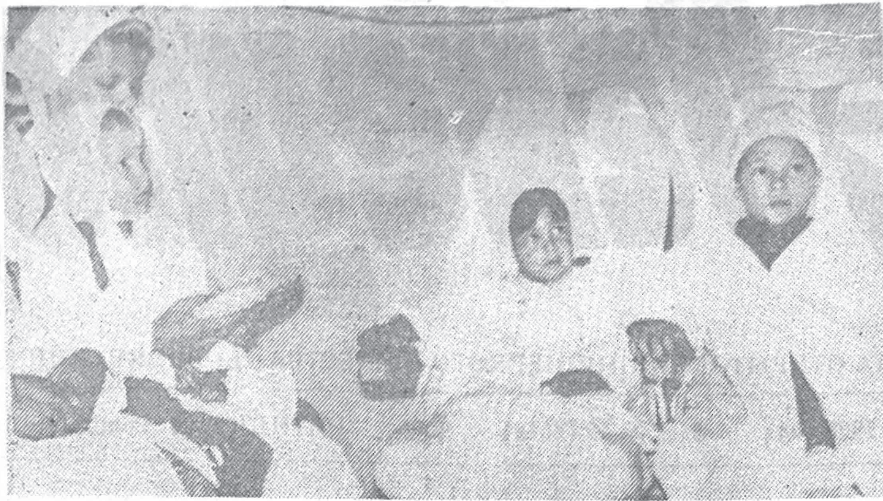
Эти снимки сделаны в нашем профилактории-санатории летом во время смены «Мать и дитя»: в галоканере (вверху); в кабинете лечебной физкультуры (справа).