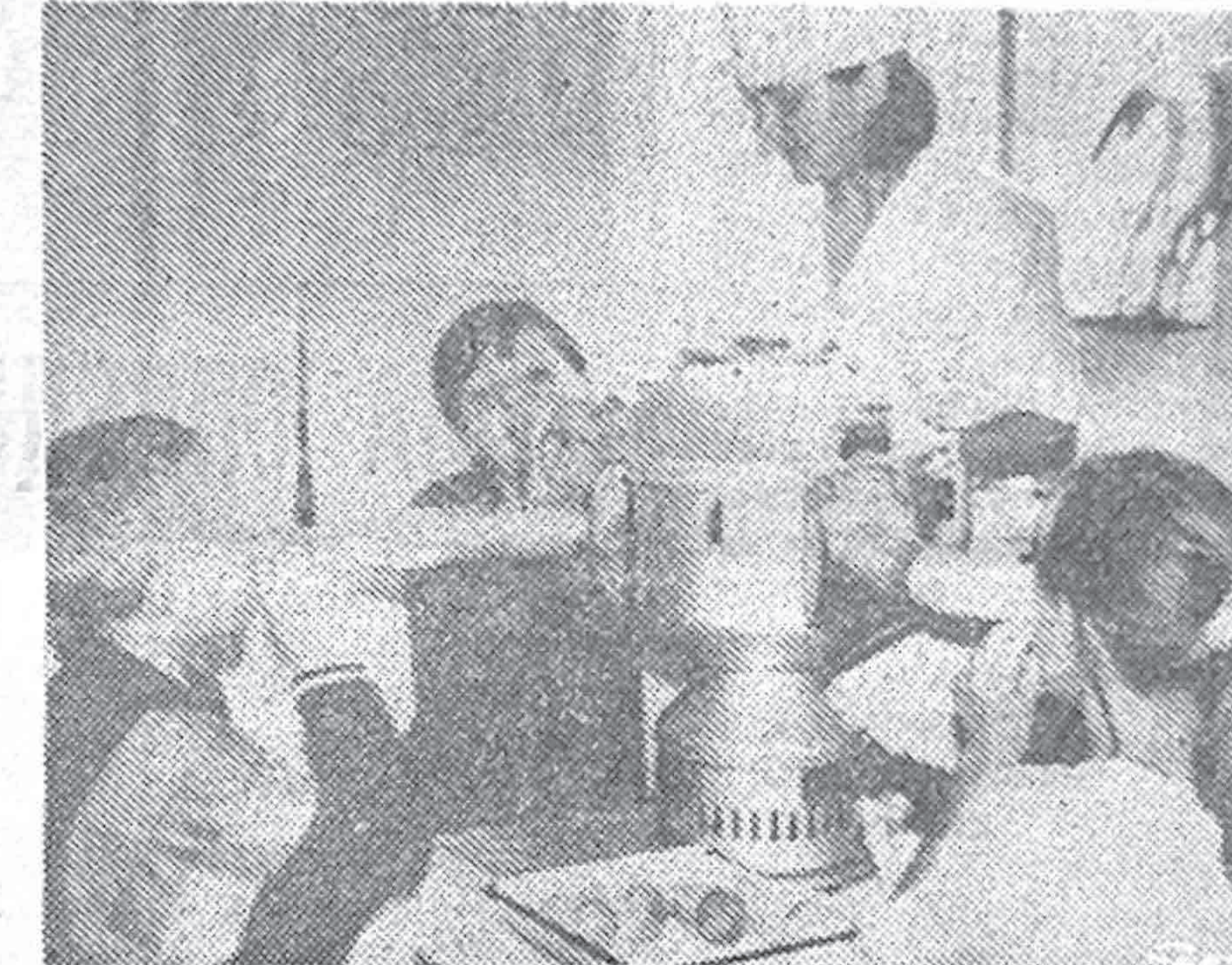
На процедуре в физиокабинете.