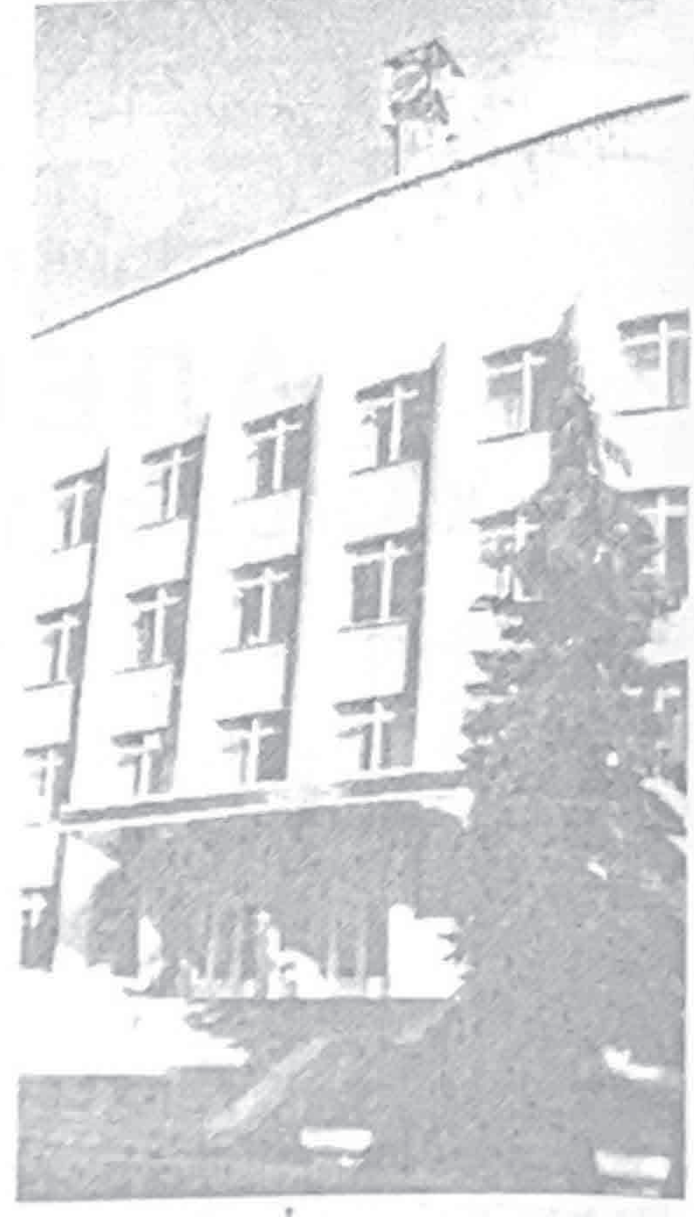
УПРАВЛЕНИЕ ОАО «БКО»