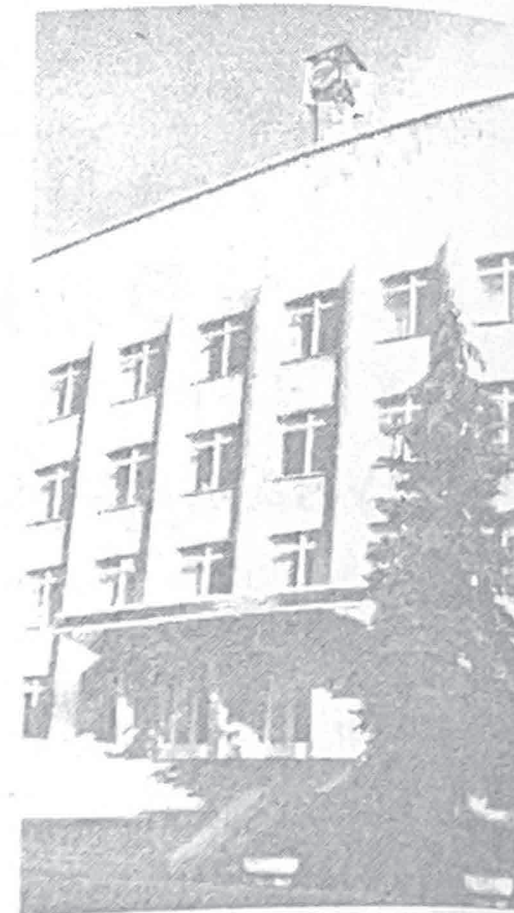
УПРАВЛЕНИЕ ОАО «БКО»