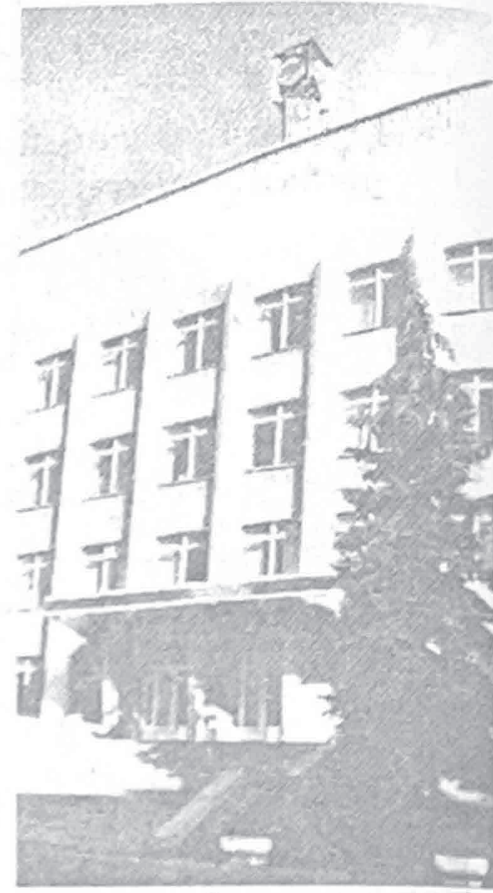
УПРАВЛЕНИЕ ОАО «БКО»