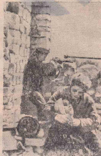
«ко не хотим войны, мы сделали все, чтобы ее не было, и ее не будет».

«Надо ли вообще вспоминать о войне? Некоторые говорят, что не надо. Я думаю, что надо. Надо до тех пор, пока человечество не в состоянии будет сказать: «Мы не толь-