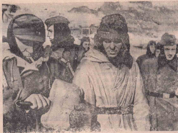
Репродукции и текст Н. Акимова.