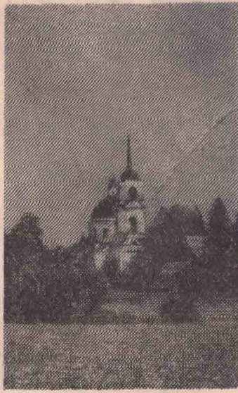
Речка Узмень. Церковь в деревне Сопины.