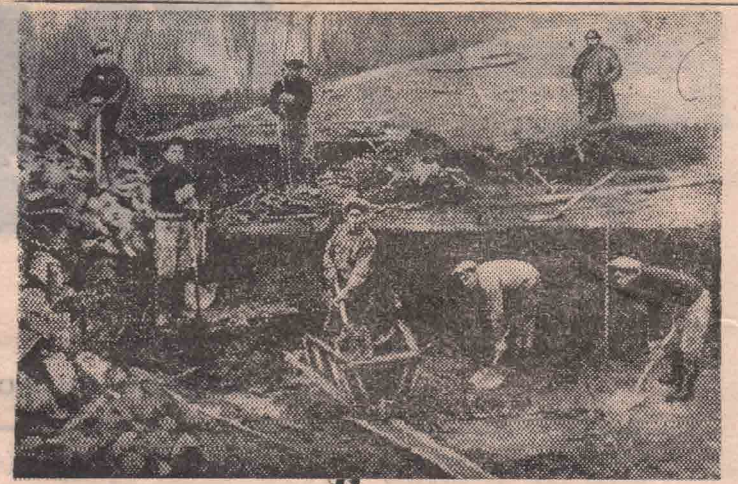
Так добывалась глина в начале века в карьерах близ Боровичей.