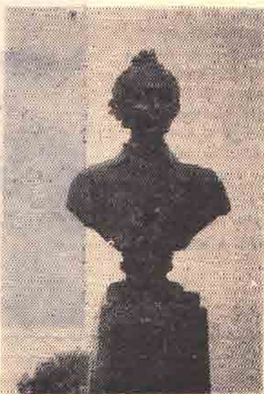
Музею А. В. Суворова в Кончанском исполнилось 50 лет. На снимках: бюст полководца перед входом в музей; дом-музей в Кончанском.

В сердце нашем ты всегда, родная, Лучше и дороже не сыскать. Твой покой и счастье охраняя, Жизнь свою готовы мы отдать.