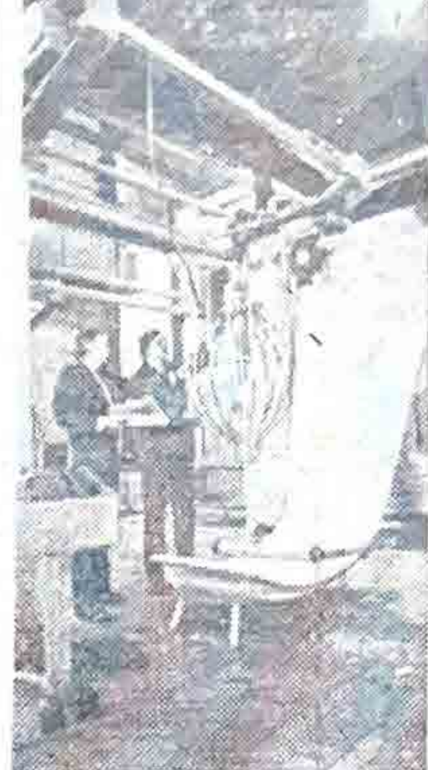
Развивая выпуск «земной» продукции, коллектив Пермского производственного объединения «Моторостроитель», известный в стране как крупный производитель авиадвигателей, взялся за производство сложных технологических комплексов для текстильной промышленности.

5. В двухнедельный срок рассмотреть предложения, критические замечания, поступившие от трудящихся в ходе обсуждения выполнения мероприятий коллективного договора, принять по ним соответствующие решения, издать приказ по комбинату, по реализации мероприятий доложить конференции трудового коллектива в 1992 году.