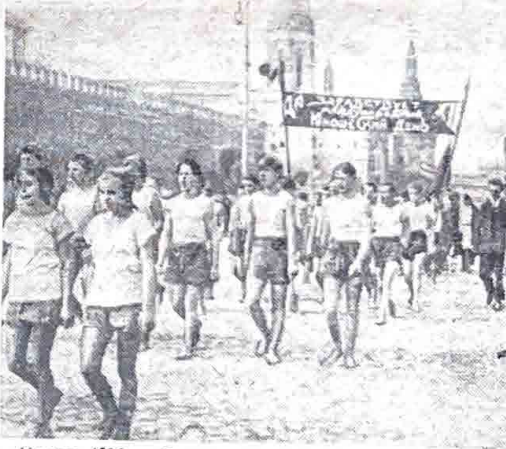
Москва, 1926 г. Физкультурный парад на Красной площ

Приглашаем любителей лыжных прогулок кататься на лыжах в воскресенье на базу «Латухино».