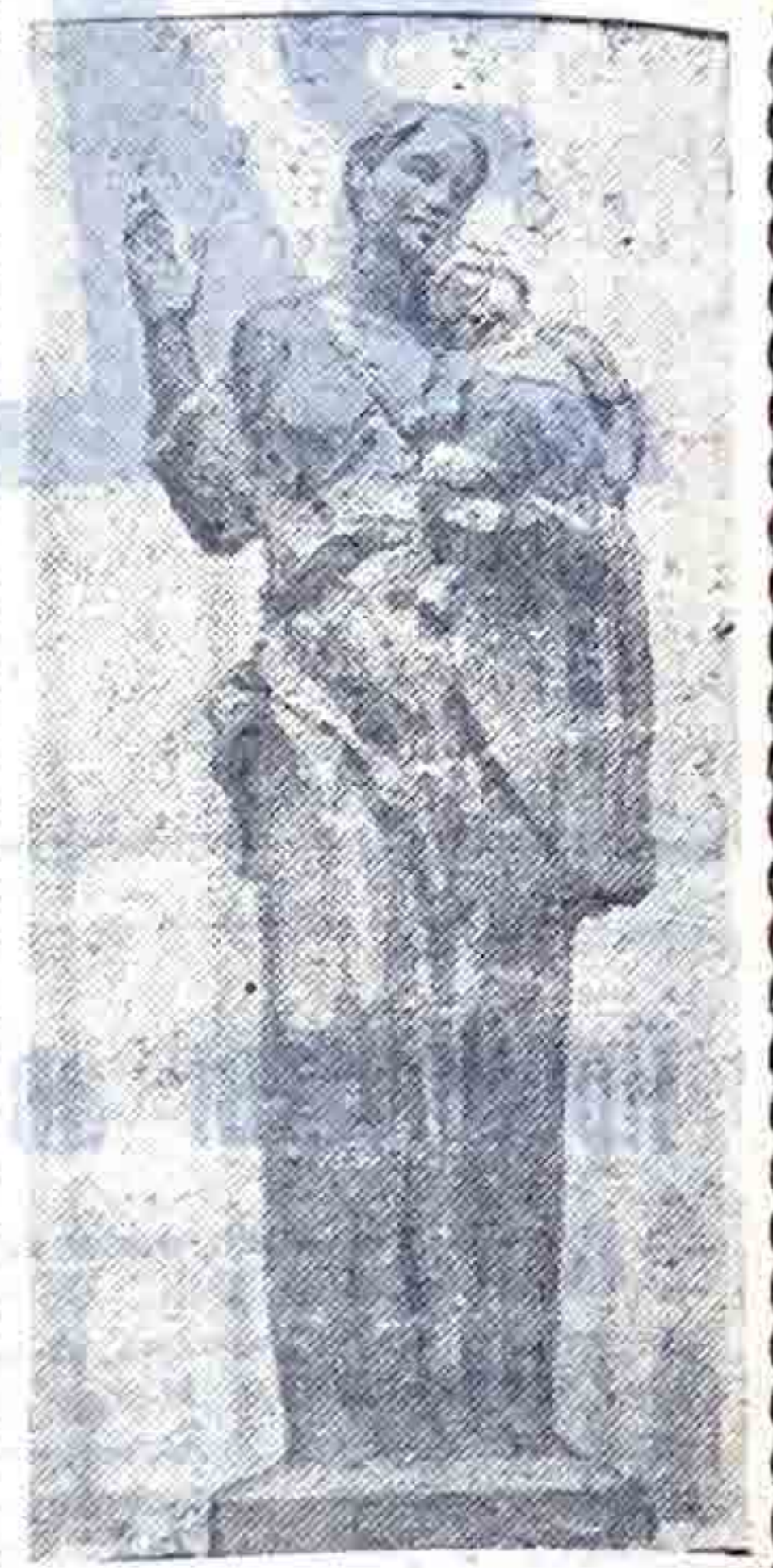
После долгих лет обсуждений, разнообразных конкурсов и выставок проектов памятника на Поклонной горе идея монумента, наконец-то, «вызрела». Вместо традиционного человека с ружьем здесь будет установлена скульптурная композиция «Мир» из бронзы и гранита, поскольку, по словам выдающегося полководца А. Суворова, «Победа — это мир». Авторы монумента — народный художник СССР, действительный член Академии художеств СССР М. К. Аникушин и архитектор Г. К. Григорьев. При подходе к центру композиции на главной аллее предполагается зажечь пять вечных огней, символизирующих память о каждом годе войны. Вокруг центральной площадки разместятся большие посадки дуба и высокоствольных пород деревьев. На снимке: скульптурная композиция «Мир» работы народного художника СССР М. К. Аникушина.

Окончание. Нач. на 1-й стр. — Что бы вы рассказали об организационной структуре таможней милиции?