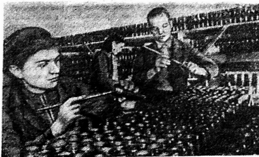
На снимках: поезд с оборудованном эвакуированного завода; учащиеся ремесленного училища собирают минны.