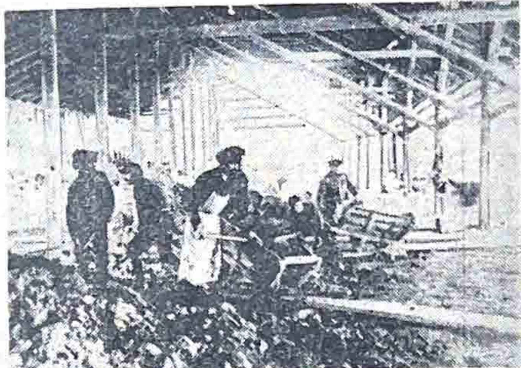
Из архива газеты. Тачка — «ручной» транспорт далеких лет...