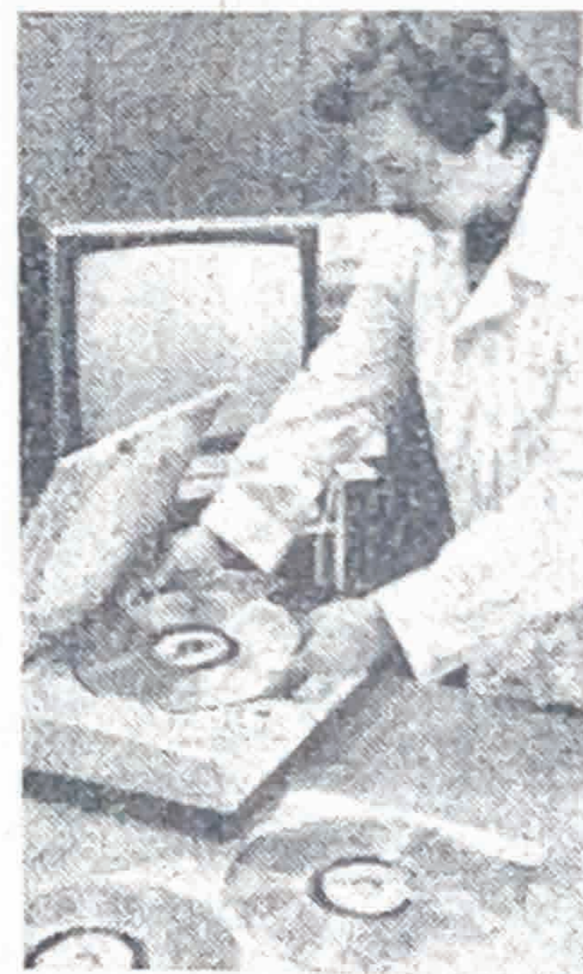
Ленинград. Первые отечественные лазерные видеодиски

изготовлены в научно-производственном объединении «Авангард». Каждый из них рассчитан на накопление до ста тысяч неподвижных изображений или до двухчасового воспроизведения видеосюжетов. Новинка в комплексе с разработанным во Львовском научно-исследовательском институте бытовой радиоаппаратуры видеопроигрывателем «Русь» ВП-201, серийный выпуск которого налаживается на предприятиях страны, значительно повышает разрешающую способность и цветовую гамму изображения, обеспечивает его моно- и стереофоническим звуковым сопровождением, позволяет использование закадровых текстов на двух языках.