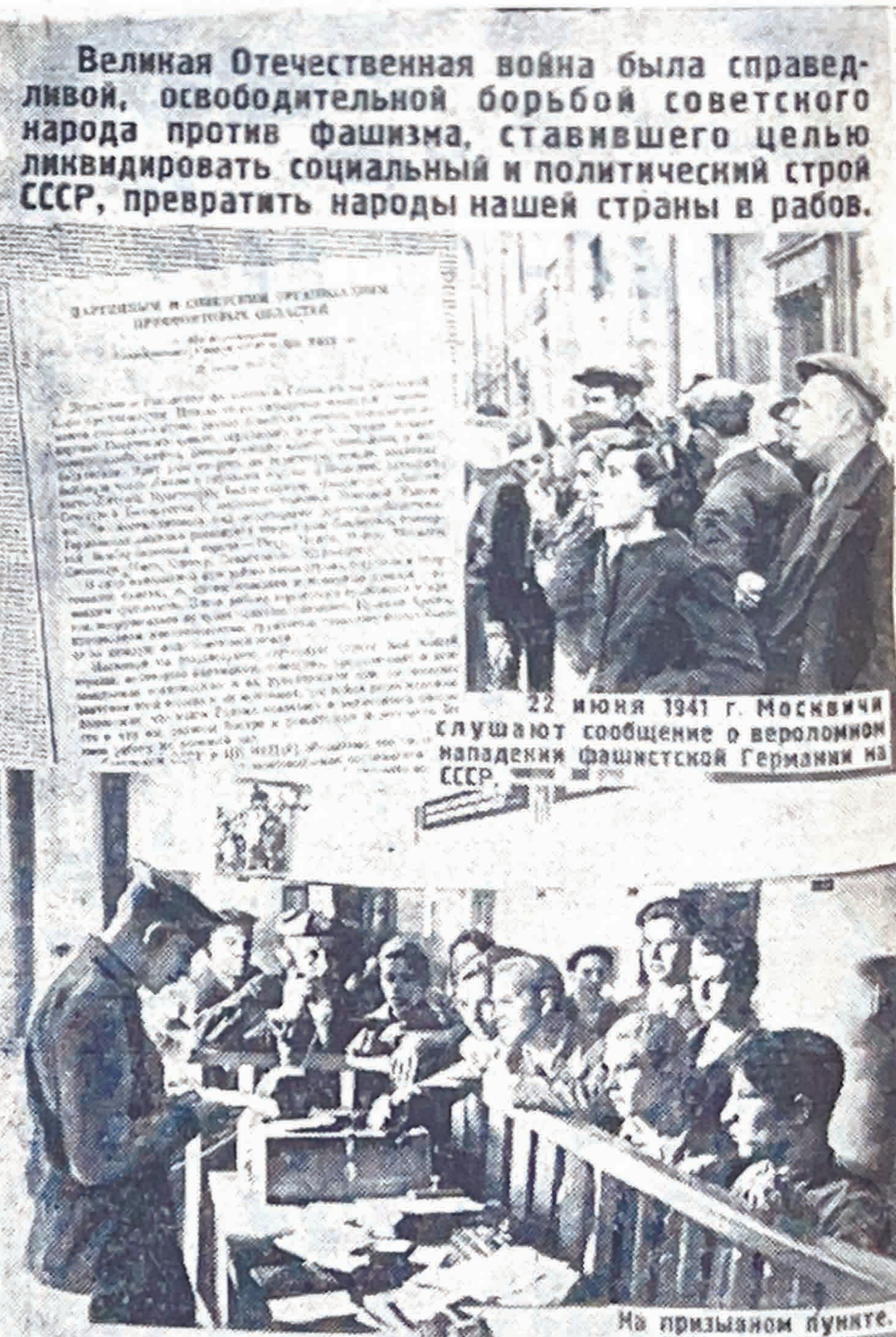
22 июня 1941 г. Москвичи слушают сообщение о вероломном нападении фашистской Германии на СССР. На призывном пункте.