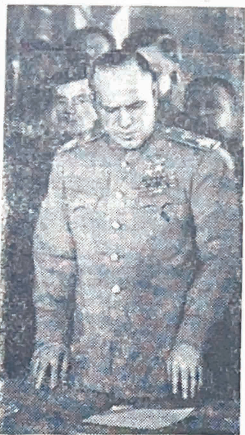
Берлин взят, война окончена. Маршал Советского Союза Г. К. Жуков во время подписания акта о полной и безоговорочной капитуляции фашистской Германии.