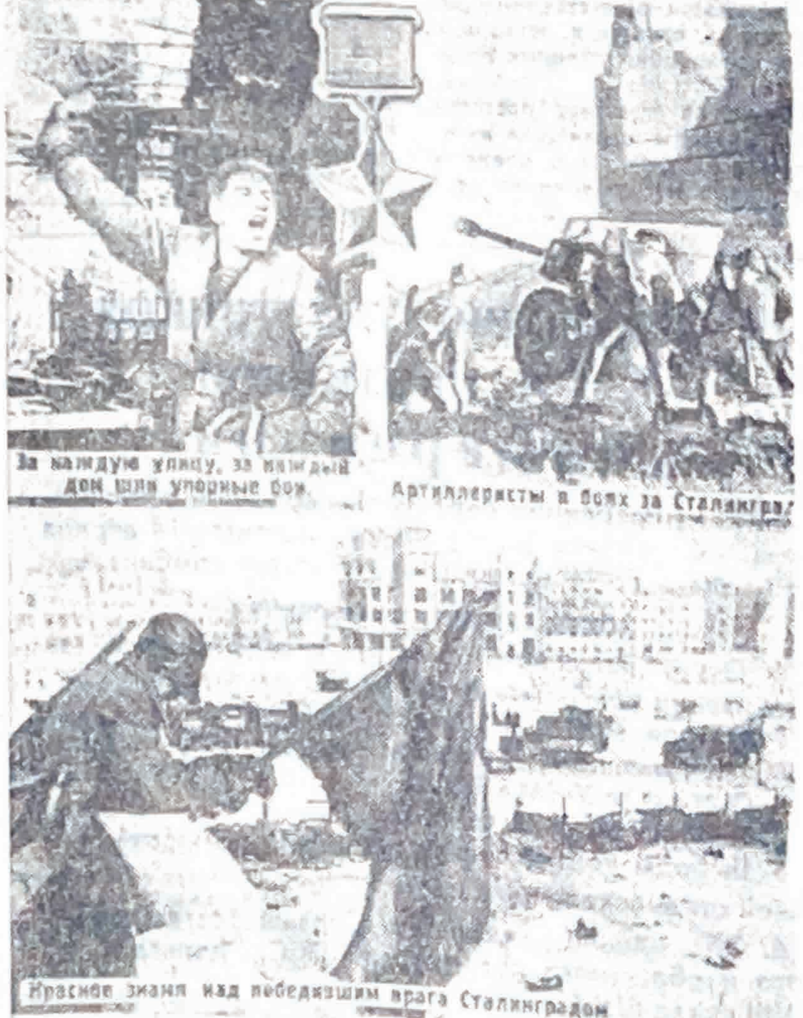
За каждую улицу, за каждый дом шли упорные бои.

Сталинградская битва, которая по своему значению и размаху превзошла все битвы и сражения прошлого, положила начало коренному перелому в ходе Великой Отечественной войны.