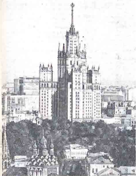
Москва — столица СССР.