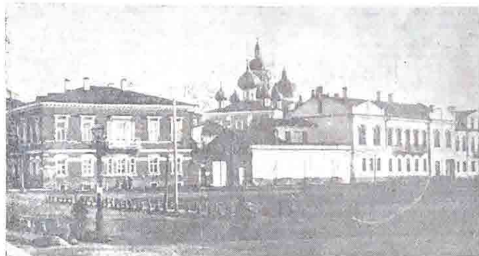
Страницы прошлого листая... Уголок старых Боровичей (ныне площадь Володарского).

Р. ПУЦИТ Позвала и стада бурно На гулях зеленых грады, Сердце твое полюбовно Затнулось небес синица, Листья плавно на землю падают, Разноцветным лопатом ковром, Что-то осень меня не радует Осенняя грусть Мерсачимь весь день дождем, Распростились с листвою зеленою, Позатих, прилежались лес, Ведь всю зиму стоять обнаженному, Ожидая весны, надоест!