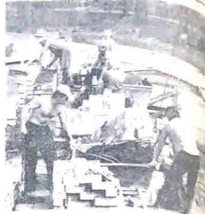
Бригада наемщиков ХСМУ на строительстве 63-квартирного многоэтажного дома по Набережной 80-летия Октября.