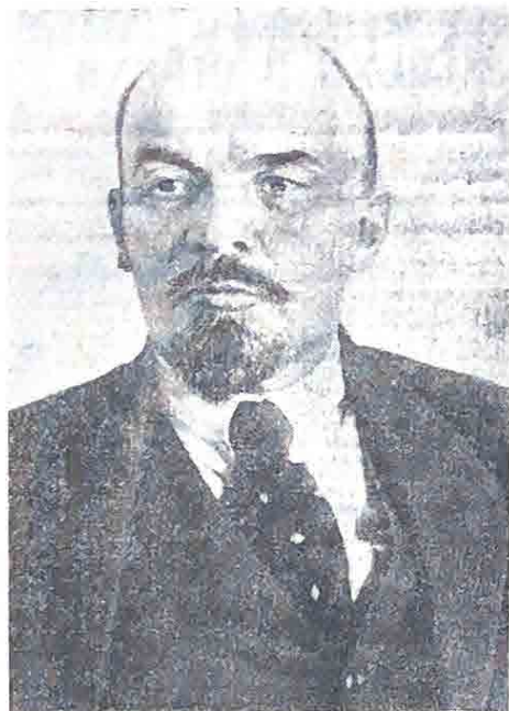
В. И. Ленин. Октябрь 1918 года. Москва.