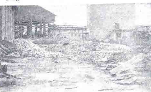
Тонны старой футеровки.