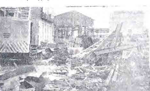
Этот металлолом ждут сталовары.

На нашем комбинате много подразделений, участков, служб. Каждая из них отличается от другой спецификой работы, количеством трудящихся и т. д. Разнится они и культурой производства.