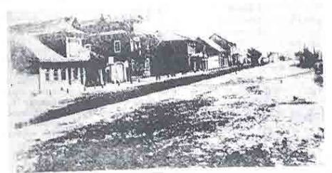
Петербургская (ныне Ленинградская) — главная улица Заводской (Славской) стороны.