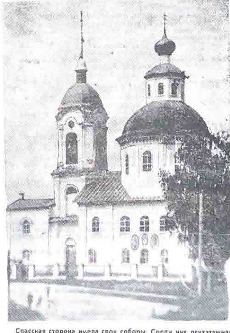
Спасская сторона имела свои соборы. Среди них двухэтажная каменная Спасо-Преображенская церковь, выстроенная в 1797 году. Сегодня на ее месте — районный Дом культуры.