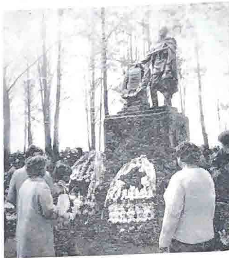
9 МАЯ, 11 ЧАСОВ УТРА. У БРАТСКИХ МОГИЛ...