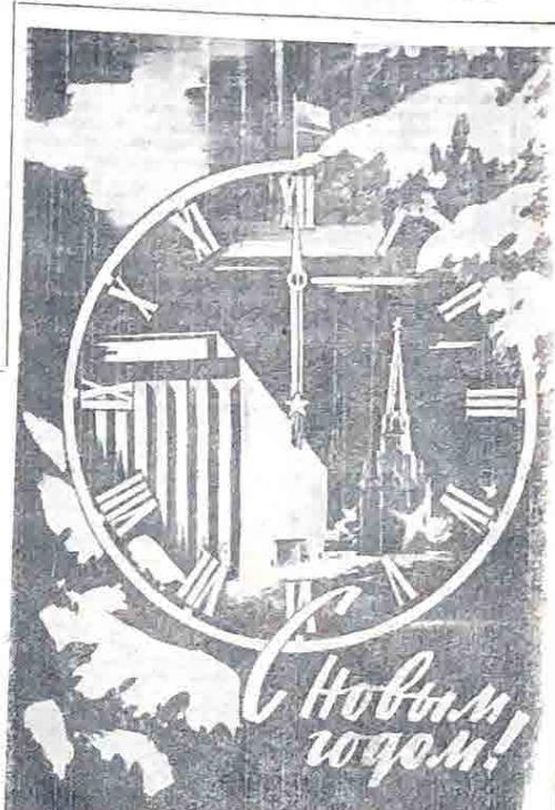
Плакат худ. В. Викторова. Издательство «Планета».