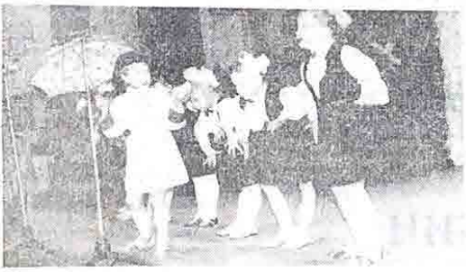
На снимках: на сцене — юные артисты музыкального ревью.