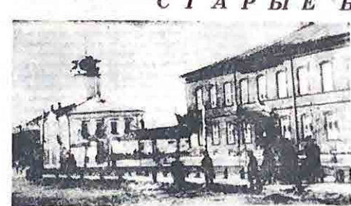
Реальное училище на Екатеринбургской (ул. Коммунарной).

Екатерининская пл. и Георгиевская ул. (Сквер им. Кирова и ул. 9 Января).