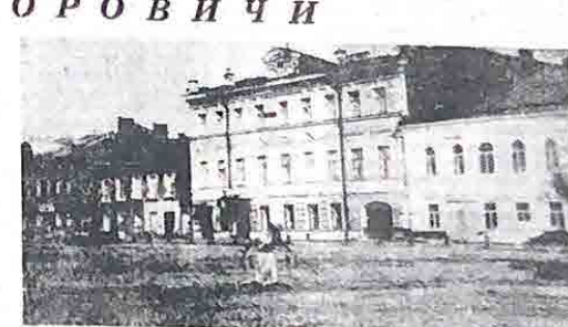
Екатерининская пл. и Георгиевская ул. (Сквер им. Кирова и ул. 9 Января).