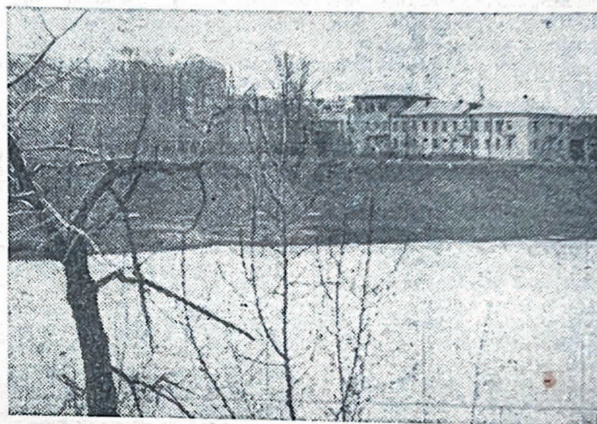
ВИД С МОСТА...

Других правонарушений со стороны работающих на комбинате в истекшем периоде не зарегистрировано.