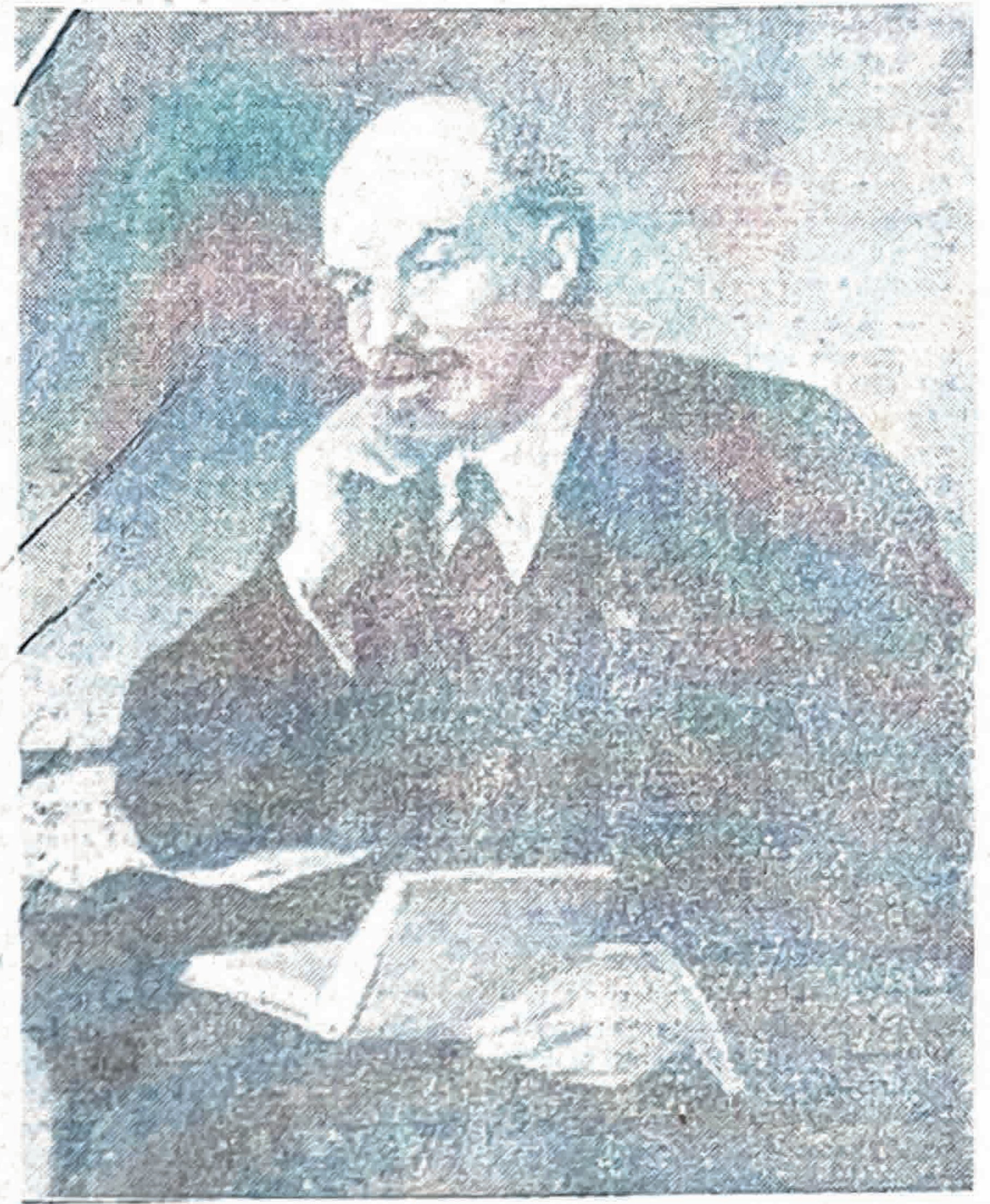
В. И. Ленин. (Картина художника П. В. Васильева).

(К 118-й годовщине со дня рождения В. И. Ленина)