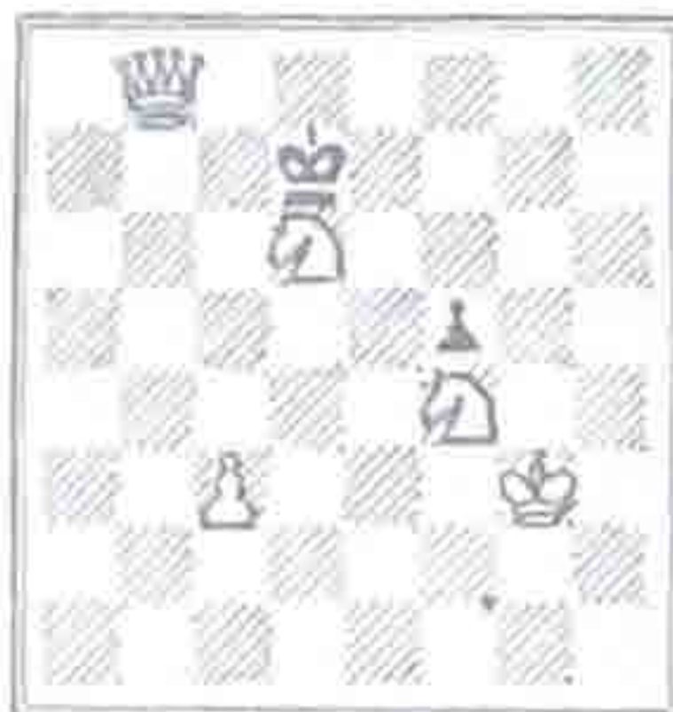
№ 167. Мат в три хода

IV ТУР № 158. Белые: КрЛ1, Лд3, Кс6, Кн6, пп.ж5, в5. Черные: Крф5 Мат в три хода. № 169. Белые: Крз3, Лд3, Св1, Св3; п.ф2. Черные: Крс1 п.в2 Мат в три хода.