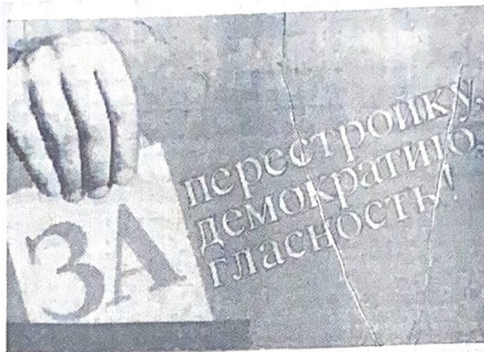
Плакат художника Ю. Леонова. Издательство «Плакат».